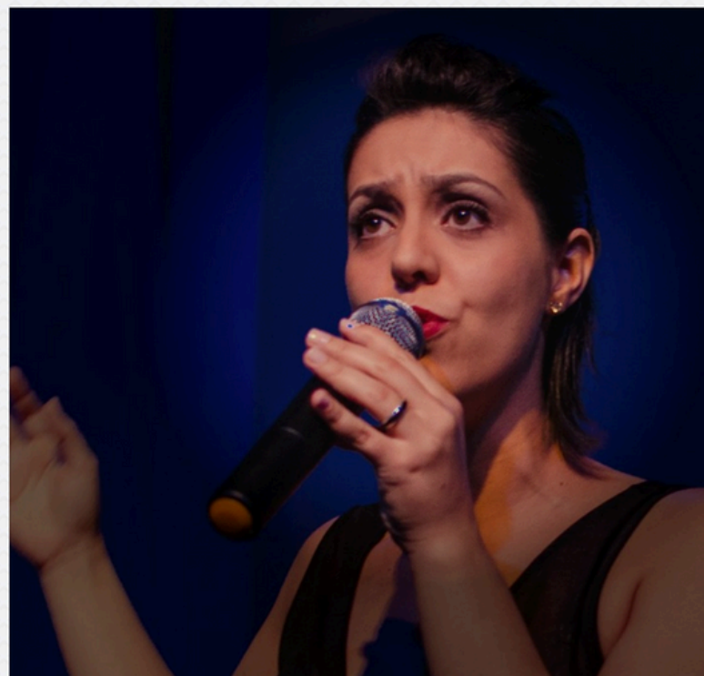
Pas de D2eux

Pocket Show que reúne canções francesas e brasileiras como uma dança à dois. Divertido e nostálgico, esse pocket show mistura gêneros e épocas musicais distintas com bom humor e uma generosa dose dramática à la Piaf. Nessa proposta artística, pretende-se divulgar a música francesa com leveza trazendo na bagagem músicas brasileiras também traduzidas no idioma francês.